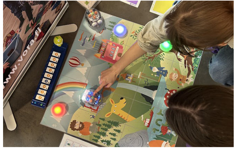
På mässan kan alla testa sina programmeringskunskaper genom att styra små robotbilar förbi hinderbanor. Messuilla jokainen voi testata ohjelmointitaitojaan ohjaamalla pieniä robottiautoja esteratojen läpi.

Greenscreen-teknikan avulla luovuudella ei ole rajoja – messuille voit kokeilla luoda jännittäviä maailmoja ja tehosteita leikki-