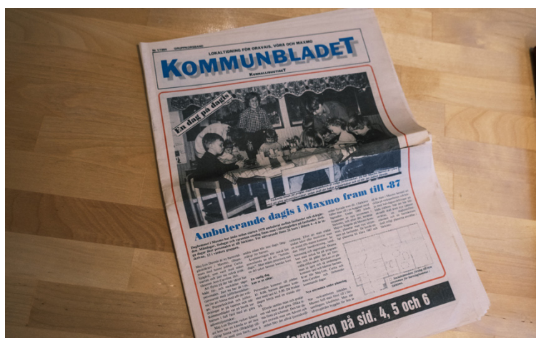
Så här såg Kommunbladet ut då tidningen utkom för första gången för 40 år sen.

DEN NYA TIDNINGEN orsakade irritation på Vasabladet. Bläddrar man i gamla nummer av dagstidningen förekommer hårda ord som ”tidnings-