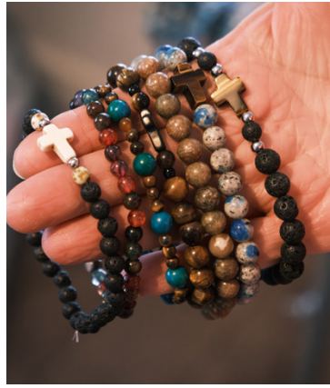
Mary Nystrand-Pärus tillverkar också smycken.

”Jag har levt med handarbetet och missionsarbetet i Kenya så länge, så det var känslolöst att se allt i verkligheten.”