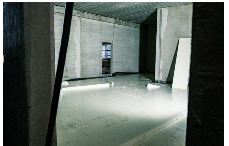
Den nya skolan blir 3644 kvadratmeter och rymmer 110 elever.