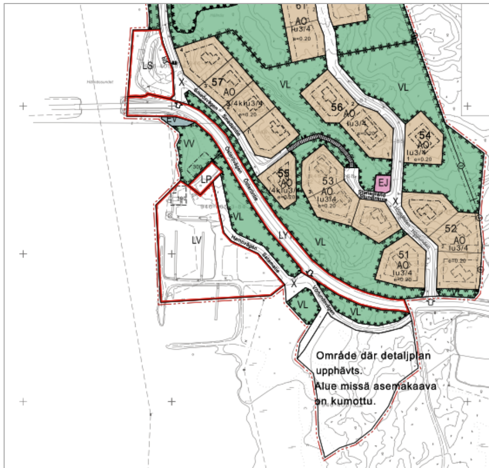
Bild. 6. Utdrag ur detaljplanesammanställningen.

Planläggningsområdet är delvis oplanerat sedan tidigare. Befintliga hamnområdet har anvisats med LV-beteckning (Småbåtshamn / småbåtsplats). Utöver detta finns reservationer för badstrand (VV), rekreationsområden (VL) samt allmän parkering (LP).