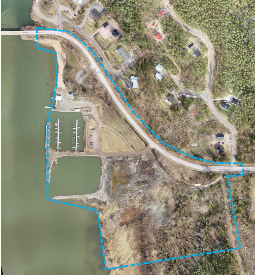
Bild 3. Flygbild över planläggningsområdet (2019) och dess riktgivande avgränsning.

Planläggningsområdet är anlagt sedan tidigare med infrastruktur och några byggnader. På området finns bl.a. en sandstrand med en brygga, en glasskiosk, grillkåta, lagerhall, två stora hamnbassänger med flytbryggor och tillhörande bilparkering. På Östra sidan av Österövägen finns ett befintligt planlagt bostadsområde som till största del har förverkligats.