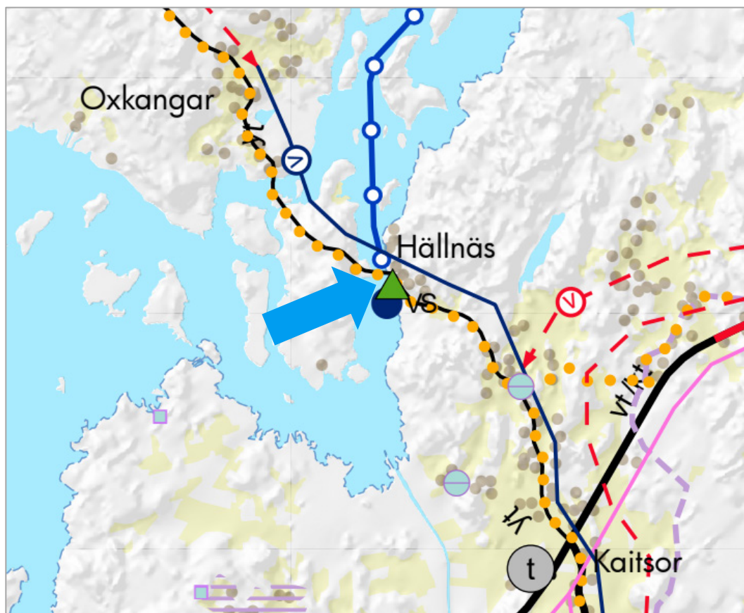
Bild. 5. Utdrag ur landskapsplanen 2040. Planläggningsområdet anvisat med blå pil.

För hamnområdet finns olika beteckningar i landskapsplanen. Hamnområdet har dels anvisats med en grön triangel som anvisar området som ett rekreations-/turismobjekt, dels med beteckning för båthamn (VS). Längs Österövägen har en Riktgivande cykelled anvisats. Farleden ut från hamnen har även anvisats norrut.