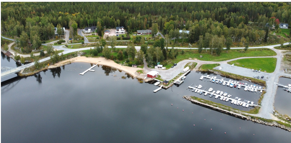
Bild 4. Drönbild över området.