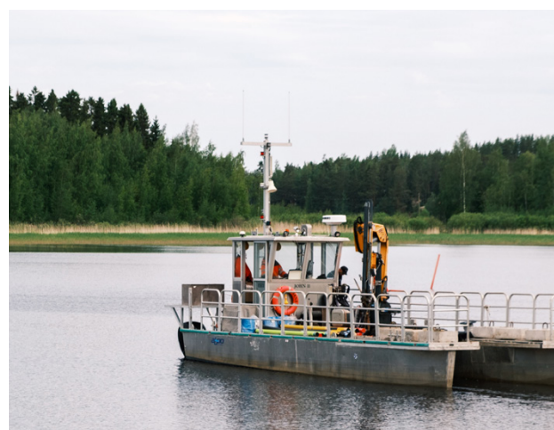
Solrutten äger arbetsbåten. Lokala båtklubbar brukar låna den när de sätter ut sjömärken i farlederna.