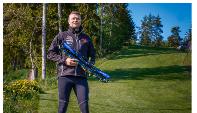
Från föreningens sida hoppas vi att ett tiotal junioråkare ska träna i backen, säger Mats Ingman.