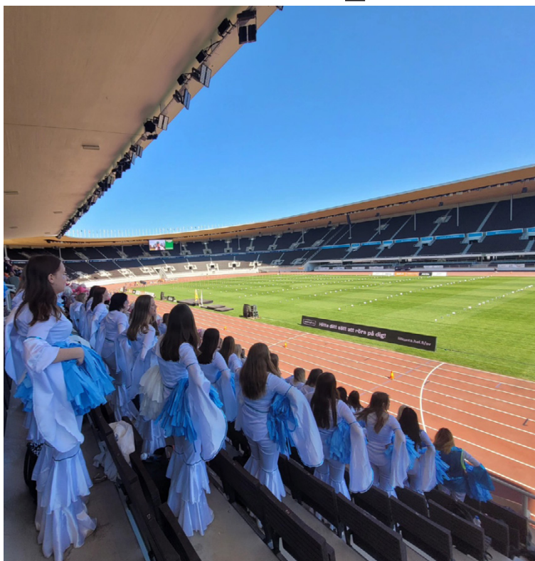
Tegengrenskolans hejarklack 2023.

Hela hejarklacken får inte reda på samtidigt att man har vunnit, utan domarna säger det endast till någon av ledarna som står längst ut. Det var alltså bara 3 av oss ledare som visste om att vi hade vunnit i början, medans resten av oss stod där på hjälpspann då det blev dags för domarna att dela ut priset för bästa hejarklack på över 25 deltagare. Men så plötsligt började en av oss ledare som stod längst ut gå och hon sade att vi alla skulle följa efter. Jag