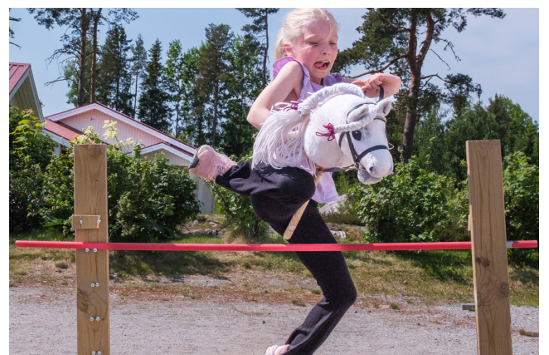
Molly hoppar högt och siktar ännu högre.

–Vi hör ofta symaskinen som smattrar när Molly syr nya hästar. Det är jätteroligt när barnen är kreativa och syr egna hästar och byg-