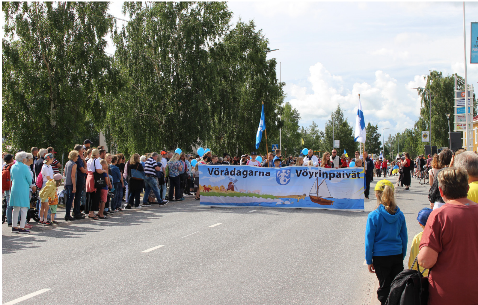
Själva idén till Langradin föddes ur ett vänortsbesök i Norge 1982.

Under sommarmarknaden kommer vi bland annat att uppmärksamma 40 åringen med en fotoutställning där