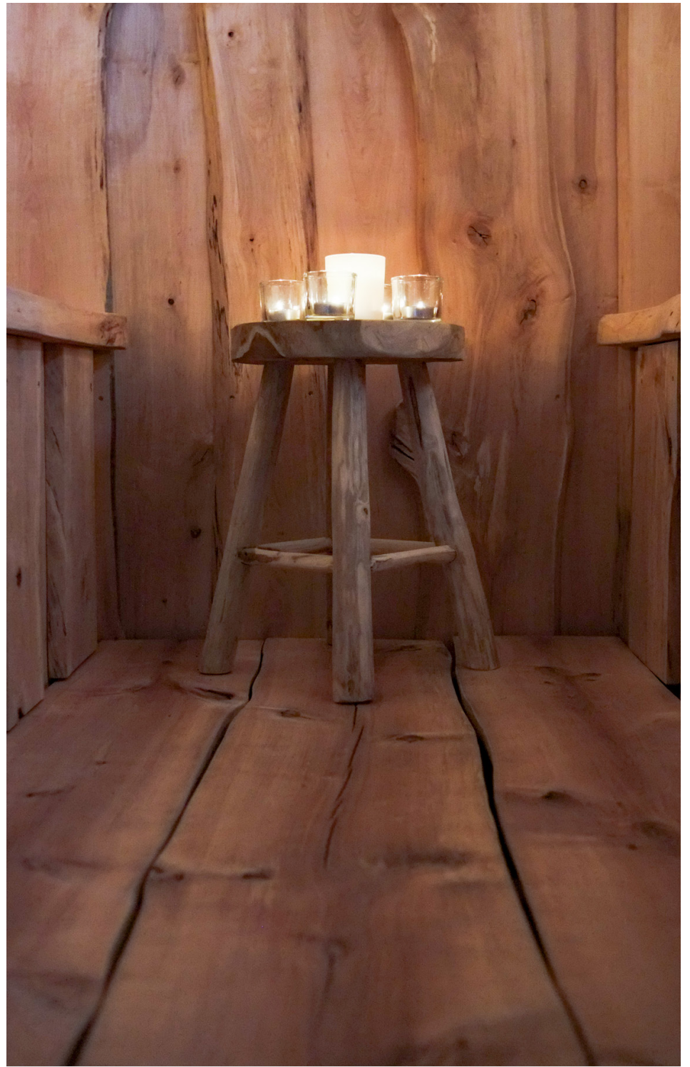
Allt från golvet till taket är gjort i samma stil.

” Det är naturligt och det finns mycket detaljer du kan sitta och se på. Man ser var kvistarna har uppkommit och på vilket sätt.”