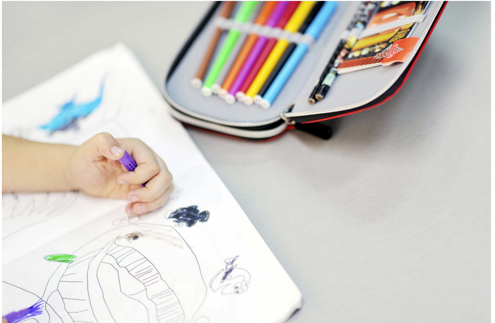
Det är i skrivande stund ännu oklart vilken eller vilka enheter i Vörå som berörs av försöket med tvåårig förskola.

Undervisnings- och kulturministeriet leder och styr verkställandet av försöket och ansvarar för utarbetandet av grunderna för läroplanen men försökskommunerna handhar det lokala verkställandet av försöket, såsom att ge tillräcklig information samt utarbetandet av en lokal läroplan.