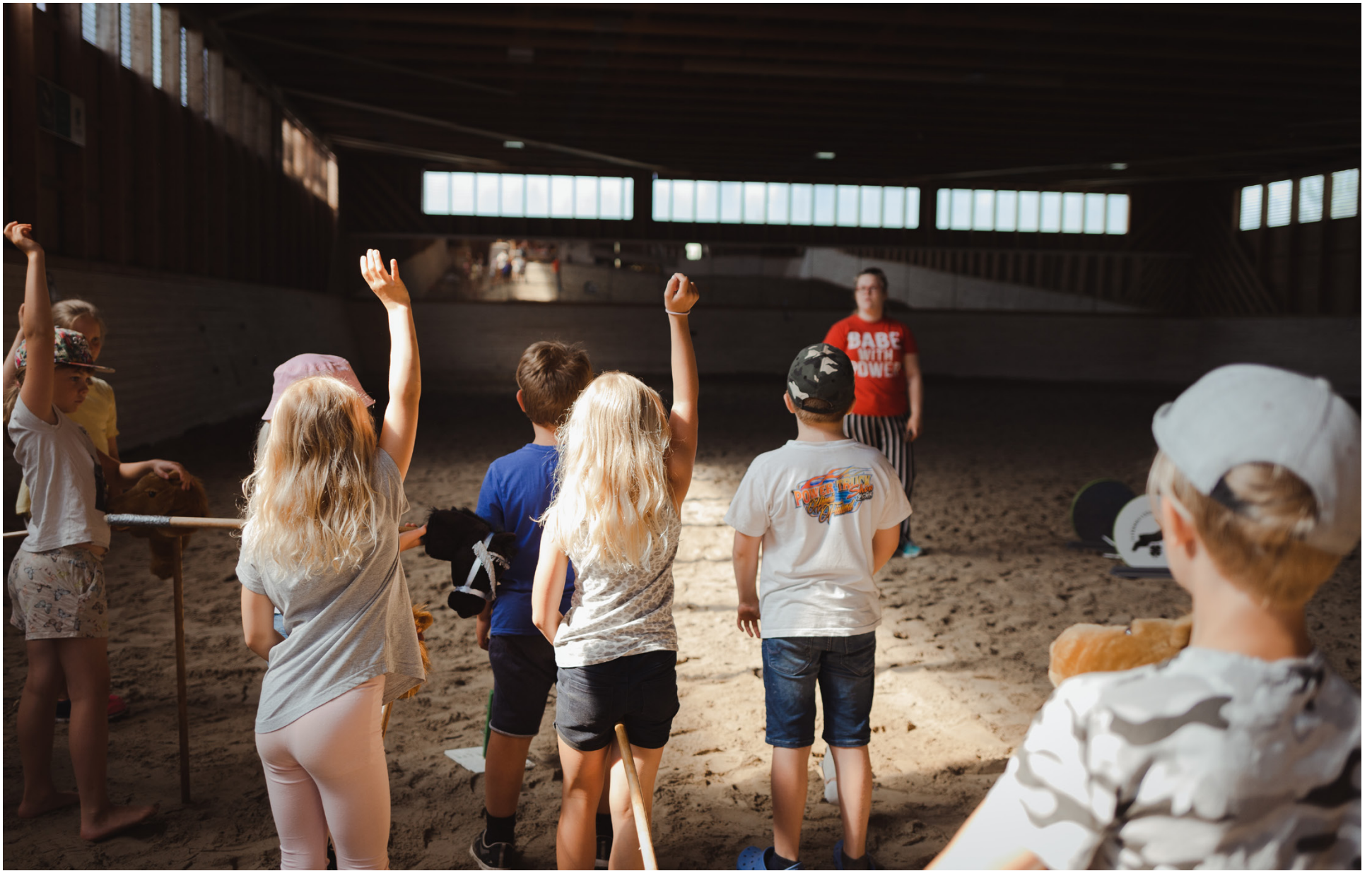
Vörånejdens 4H samarbetar med Stiftelsen Rasmusgården och föreningarna som håller till vid Rasmusgården under sommaren. Bilden är från sommaren 2020 när lägerdeltagarna hade käpphästtävling under daglägret Äventyrsveckan på Rasmusbacken.