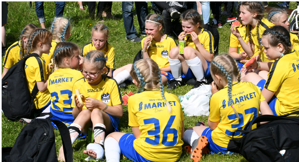
Fotboll passar för alla, det är bara att våga ta det första steget.