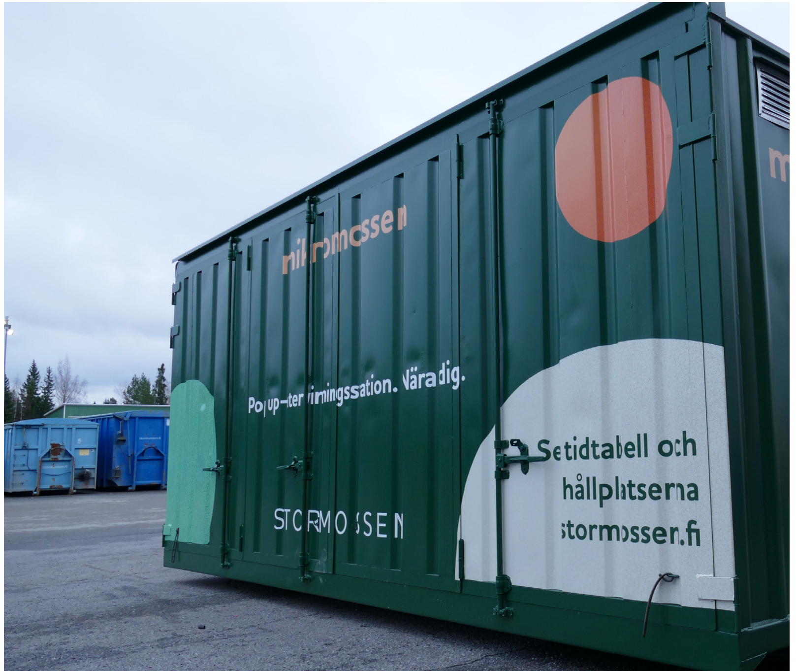
Mikromossen är en ny tjänst som Stormossen startat i år. Den är en återvinningsstation i en container som kör i Maxmo vissa lördagar.

Kom ihåg att ta med kundkortet. Varje besök registreras för att få reda på kund-