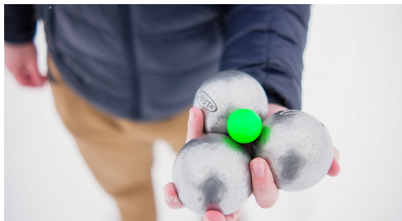
Petanque kan spelas oberoende av ålder, kön eller kondition.