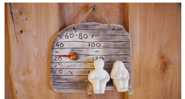
Sören Nyqvists vildmarksbastu är gjord enbart av trä.

Även bastutrappan och bastulaven är byggda enligt samma metod. Dessutom så har Nyqvist byggt laven extra