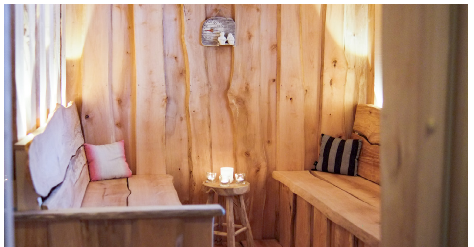
Till och med bastulavarna är gjorda i vildmarksstil.

Men hur länge tog hela projektet då? Det hände inte över en natt, det är säkert i alla fall. Med rivande, där fa-