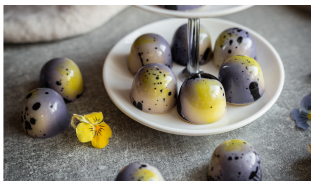
Att tillverka en pralin tar två till tre dagar.

att det är viktigt att allt är lokalproducerat. Chokladen jag använder ska vara av bra