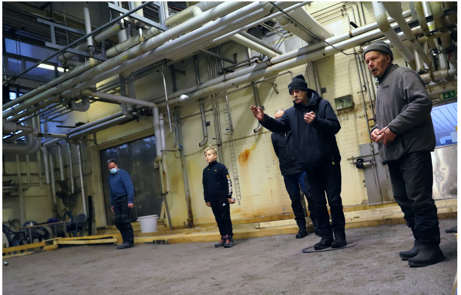
I den nya hallen finns mycket spelrum för metallkloten som kastas på grusbanan.

– Det finns de som sagt att de kommer men avvaktar med coronan. Då vi får sprutan i axeln kan allt bli annorlunda. Det är klart vi vidtar coronaregler då vi spelar. Vi håller avstånd och vi har spritflaskor på plats och vi kysar inte kind och skakar inte hand. Vi försöker hålla av-