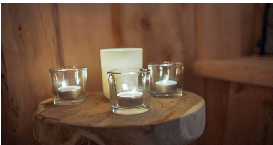
Det finns många fina detaljer att se på i vildmarksbastun.