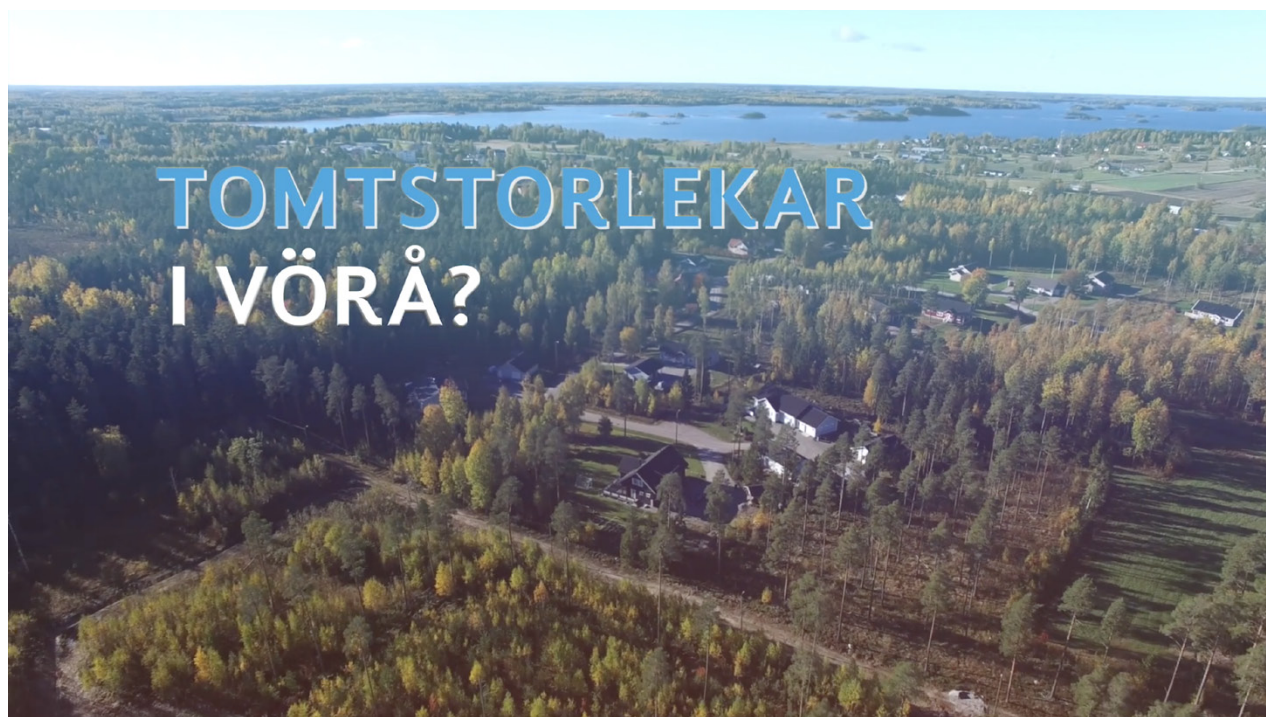
Rapp takt och fina bilder, det är #vörågood.

Vi funderade då på om Vörå är bra? Kunde vi testa det på olika områden, både med en informativ ingång och med glimten i ögat? Eftersom kommunen utsätter sig själv för test, blir svaret förstås att Vörå är bra! Som travesti på engelskans "very good" är kommunen #vörågood, en hashtag vi hoppas att stolta vöråbor och glada besökare vill använda i flera sammanhang då de postar något om Vörå i sociala me-