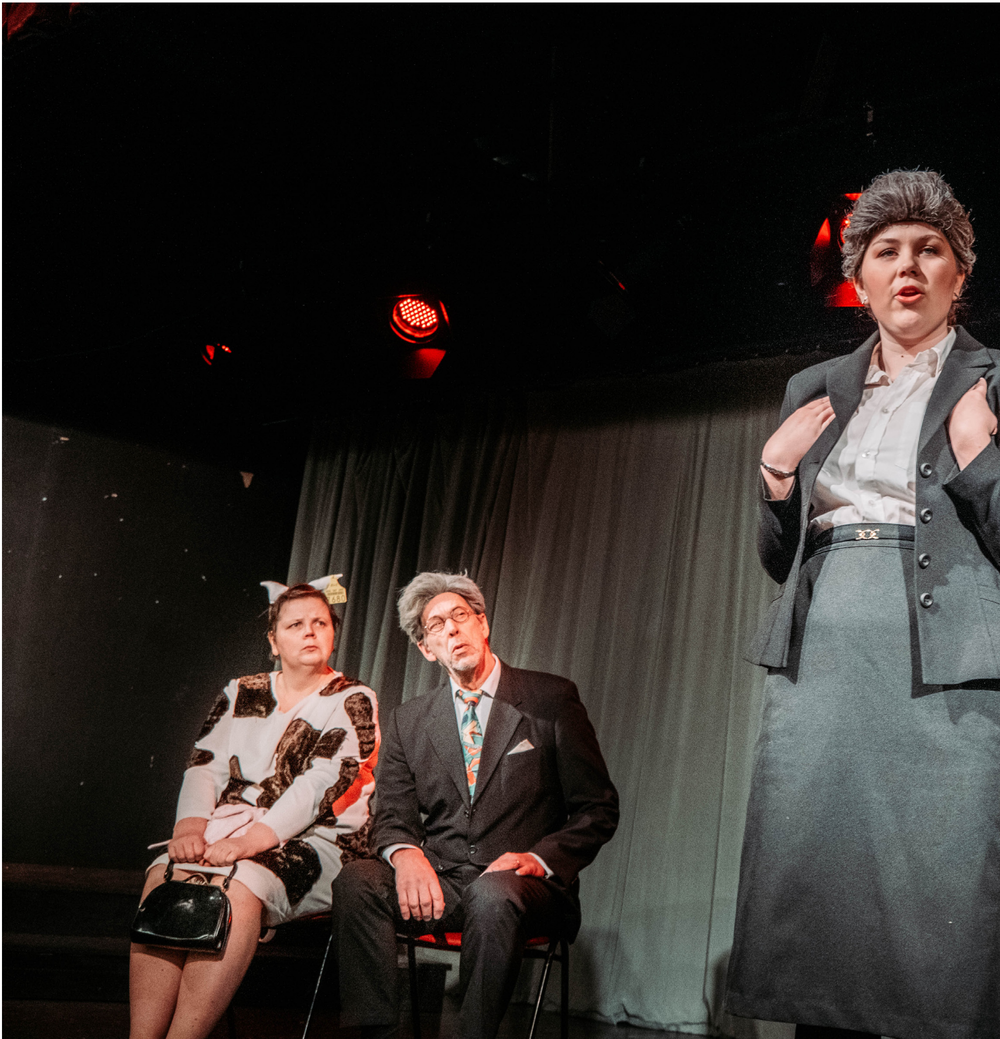
En av akterna i Byarevyn handlar om när en ko var i tingsrätten i Österbotten