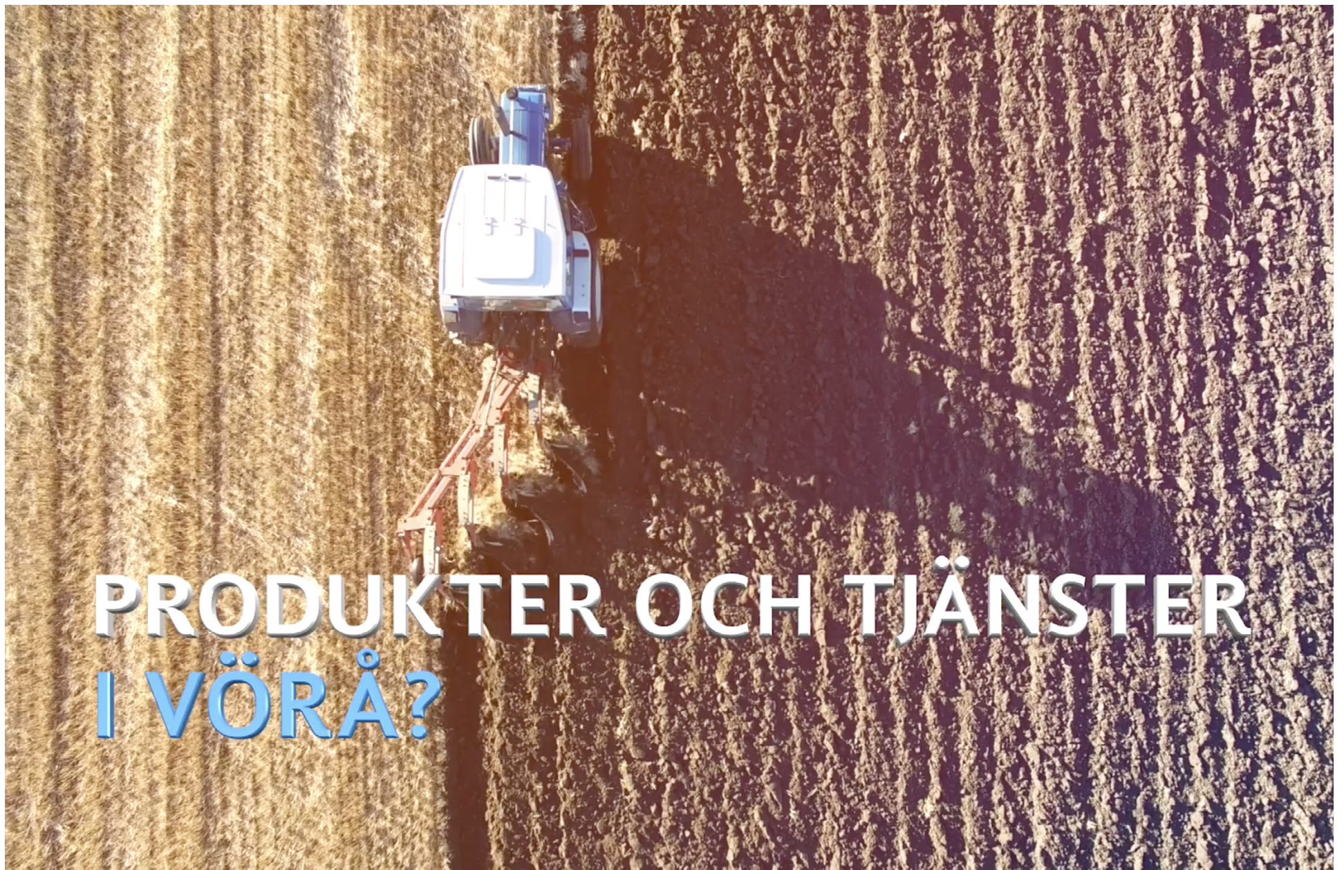
I #vörågood-serien lyfts olika teman upp i varje video.