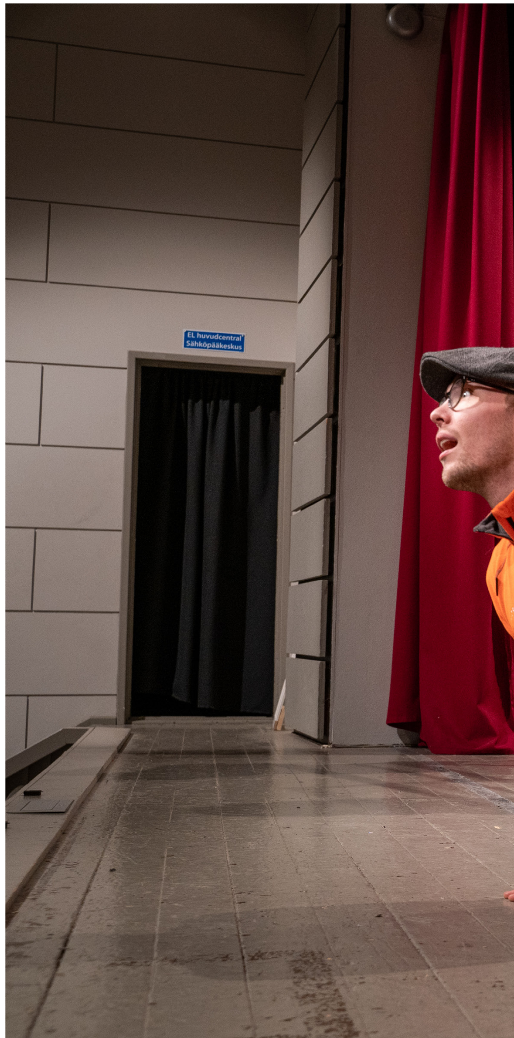
När Vörå Ungdomsförening ger sin 51 revy bjuder föreningen på "lull-lull".