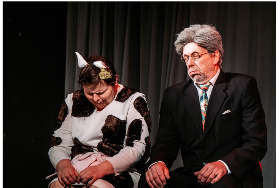
Byarevyn är en blandning av välskrivet material, en gnuttu ironi och en stor näve humor.