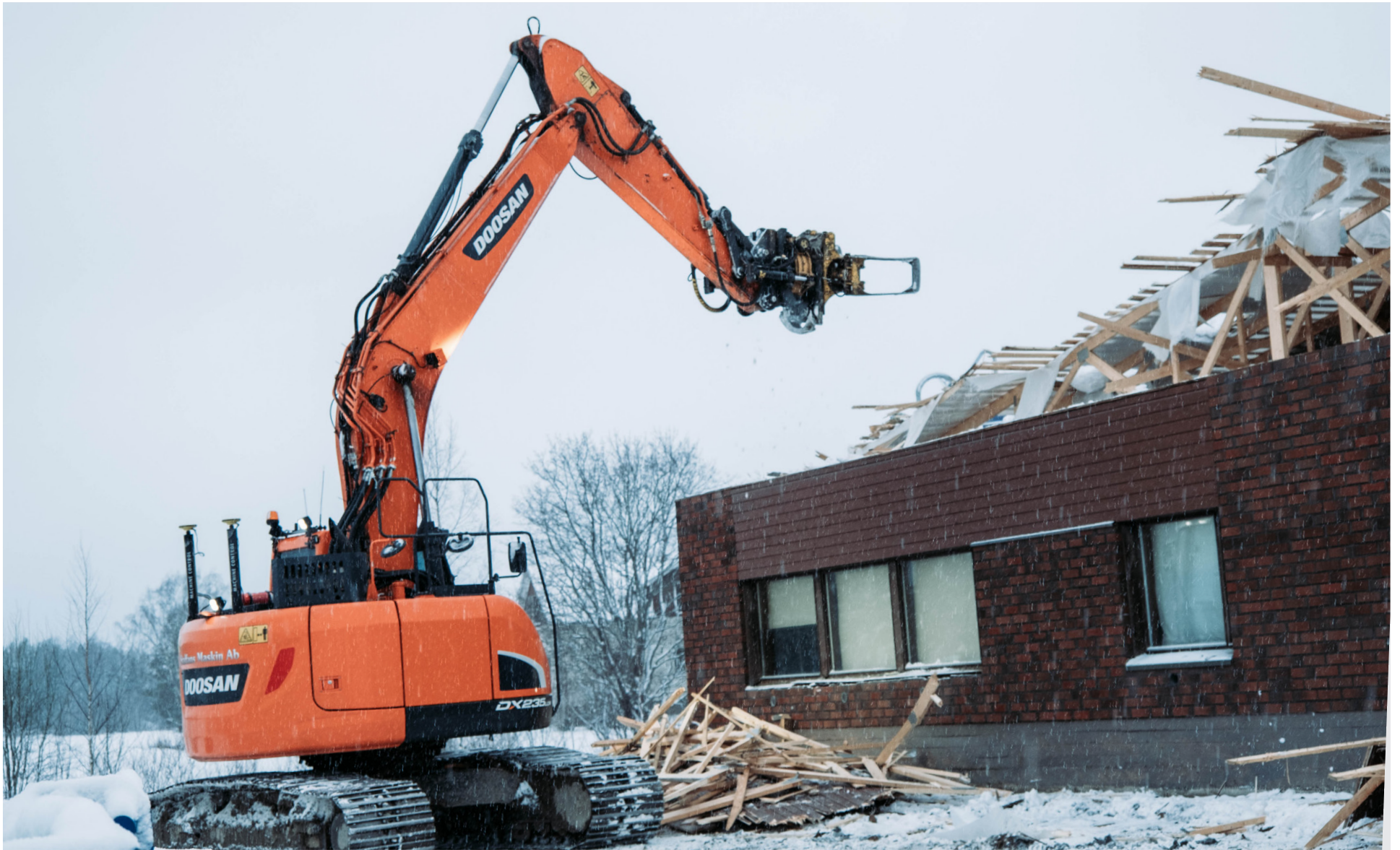
Den gamla brandstationen började rivs i januari.