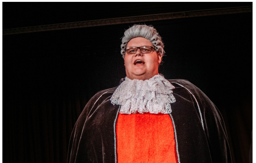
Ibland får man vara kreativ när det kommer till dräkter. Som domaren som har en matta på framsidan för att ge en färgklick till utstyrseln