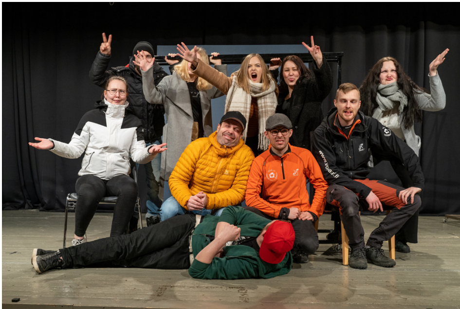
Vörå ungdomsförening är ett glatt gäng som gärna bjuder på sig själv.