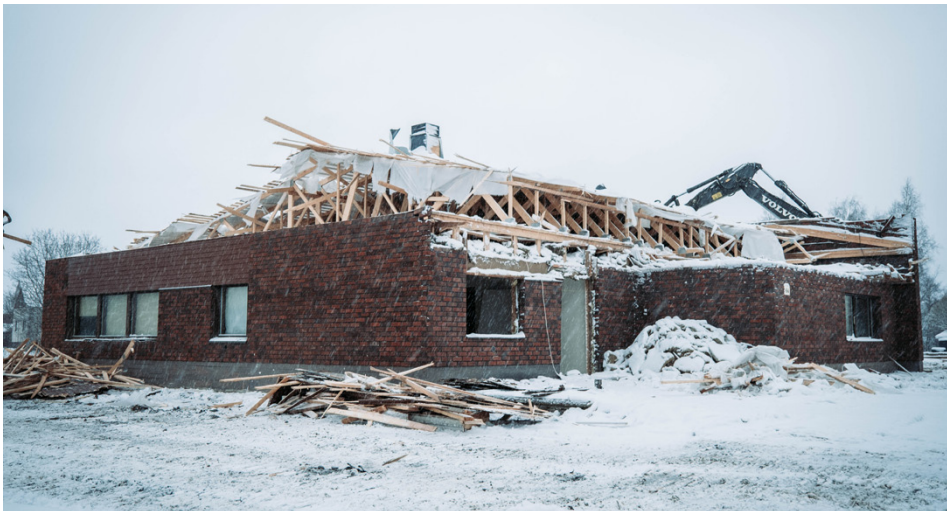
Gamla brandstationen revs på några dagar.