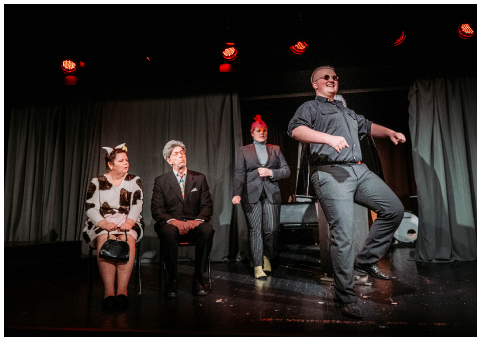
En blind mullvad från Jakobstad gjorde entré i revyn.