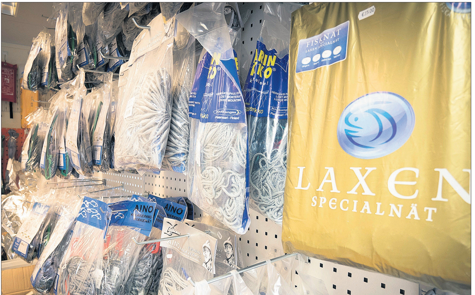
Fiskenät är en av produkterna som är populära på Stig In.