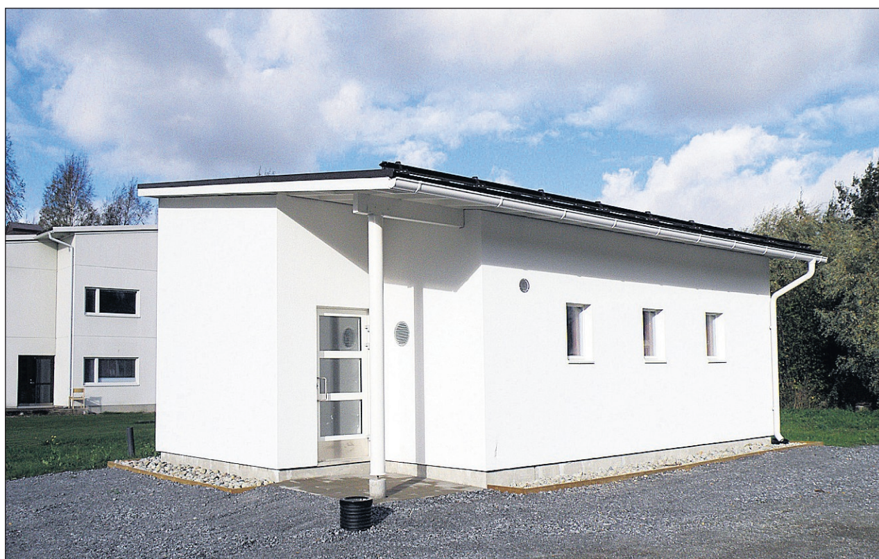
Skyddsrummet vid gymnasiet internat.