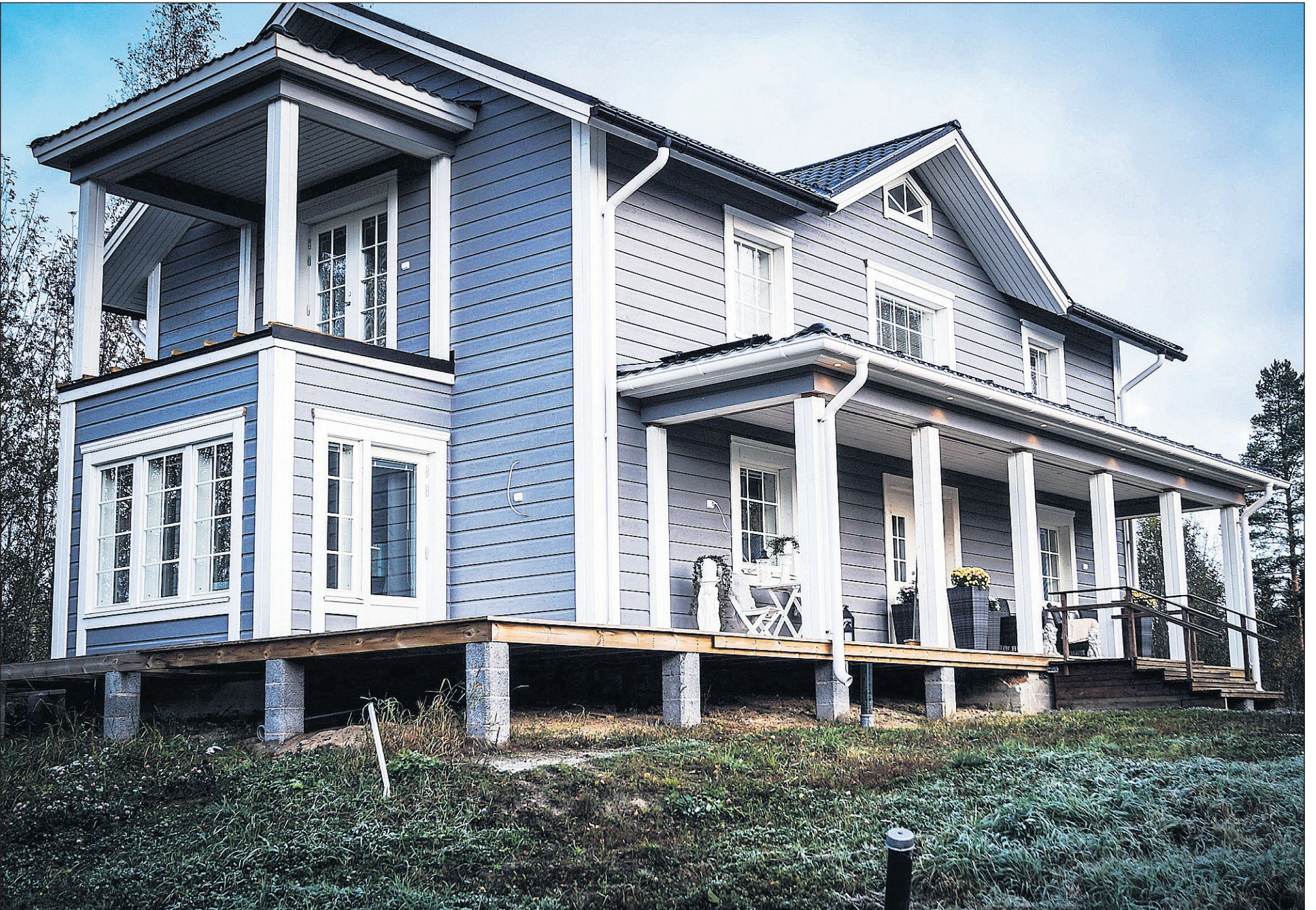
På utsidan märker man inte av att huset är byggt på slutet av 1800-talet.