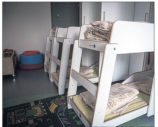
De uppfällbara sängarna frigör utrymme när barnen inte sover.