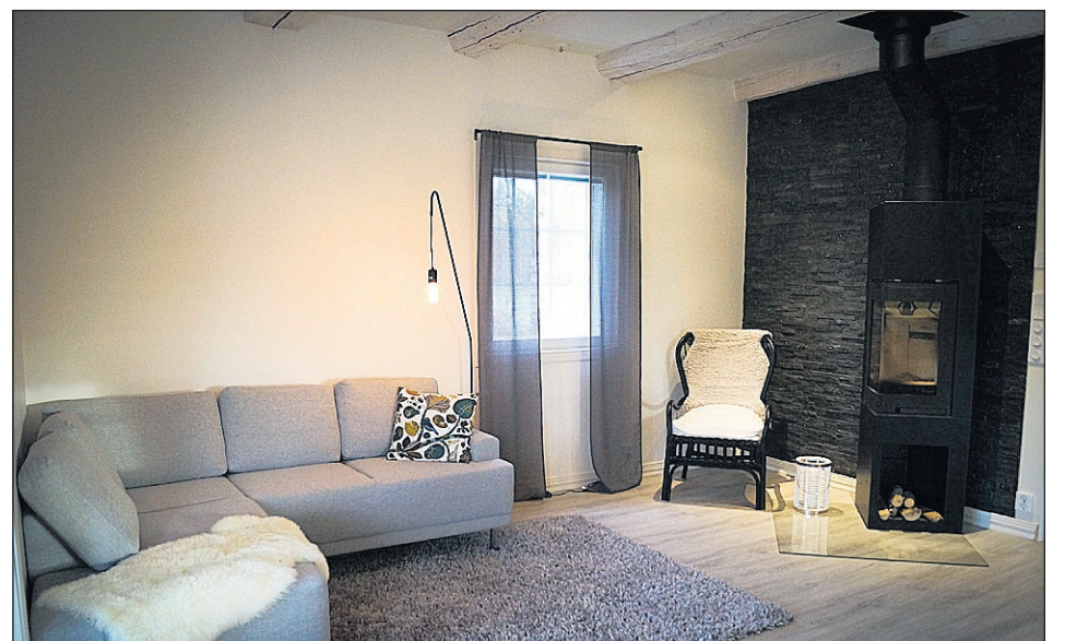
Efter renoveringen lämnade Fleen och Sundsten kvar de gamla stockarna i taket.