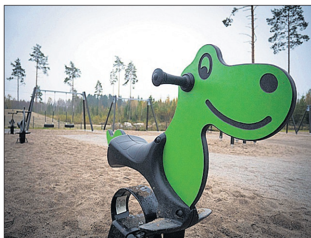
Det barnen uppskattat mest är kanske de nya leksakerna både på gården och inomhus.

Det barnträdgårdslärarna fått höra från barnen är att