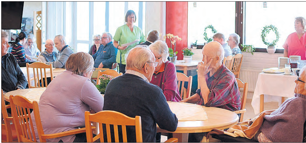
Omkring 30 personer deltog i jubileumskaffet lördagen den 17 oktober. Bland gästerna fanns både patienter, personal och anhöriga.