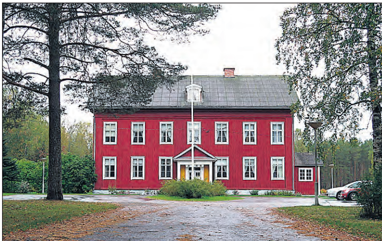
Nästa steg kring herrgården är utredningen av möjligheten till ett planeringsprojekt som ska fastställa den framtida verksamheten.