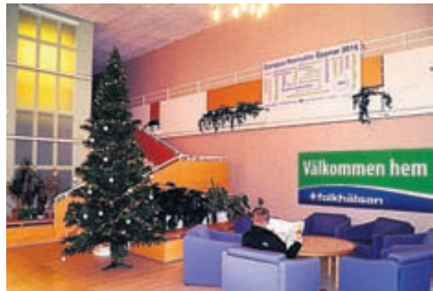
Tämä seinä kätkee taakseen Vöyrin ruotsinkieliselle yhteisluokille-urheilulukiolle remontoitavia tiloja.

– Kurssitarjonnassamme pyrimme ottamaan huomioon kaikki vauvaikäisistä eläkeläisiin. Uutuutena tarjoamme muun muassa uusia