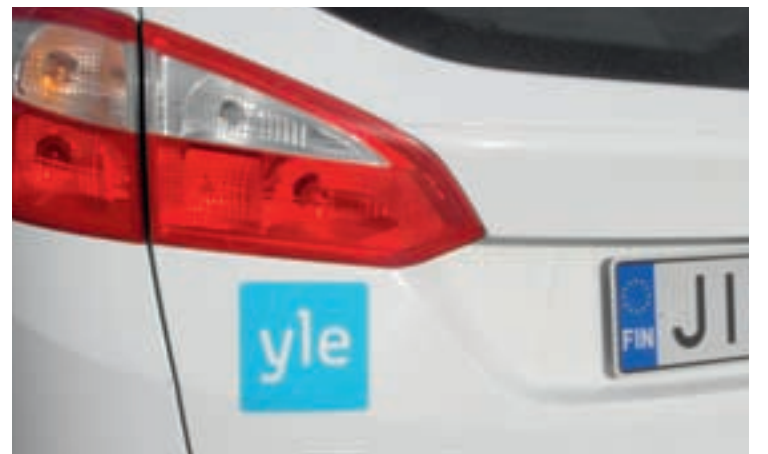
Radions bilar styr snart kosan till Vörs.

Redaktion för denna bilaga: Tämän liitteen toimitus: Ulf Sundstén, ansvarig utgivare Anders Bäck, layout Ann-Sofi Bäck Martin Klemets