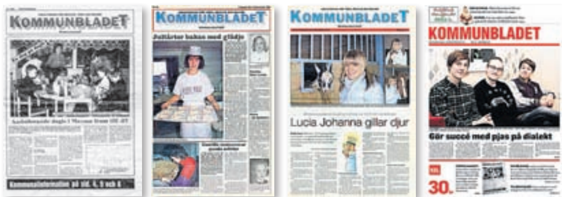
Kommunbladet i december 1984, 1994, 2004 och 2014

Kommunbladet har under 30 år presenterat många intressanta nyheter, händelser och människor i Vörå, Oravais och Maxmo. Välkomna med på en lång vandring, som ändå bara omfattar en bråkdel av det omskrivna, genom Kommunbladets historia!