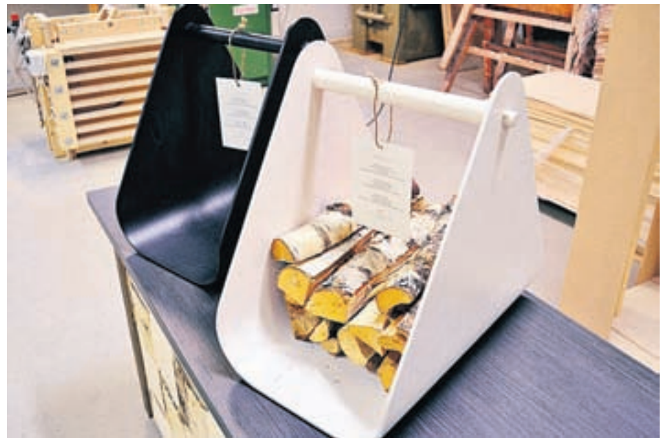
Nattsvart och kokosvitt. Vedkorgen Carry Me är både stilren och enkel.