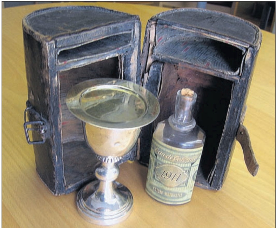
Detta sockentyg av äldre datum är inte mera i bruk. Det förvaras i församlingens arkiv som museiföremål. Den ursprungliga vinflaskan hade ett ingraverat kors, men den har tydligen gått sönder och har ersatts med en Eau de Cologne-flaska, som råkar vara av passande storlek.