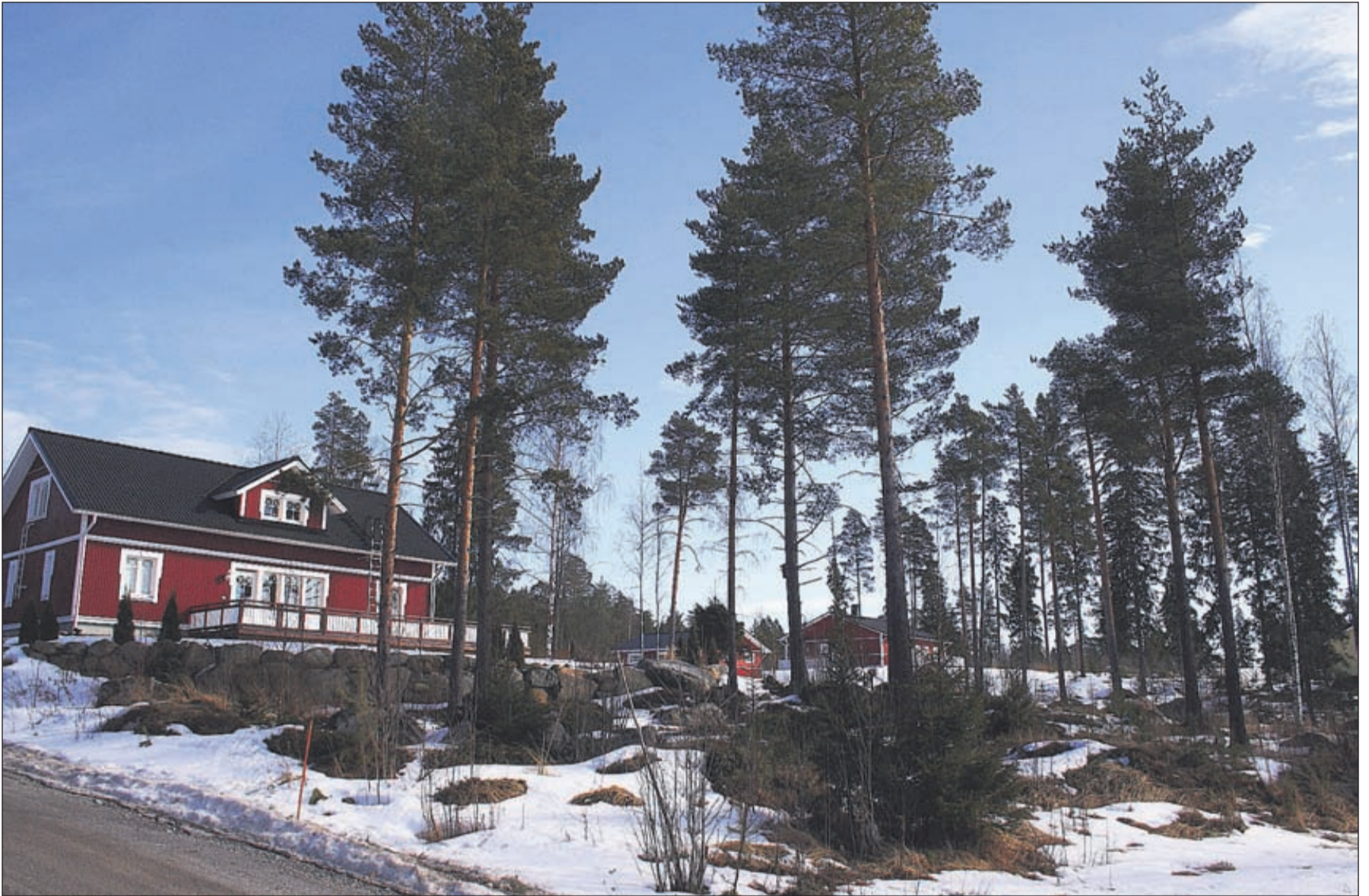
Kirkonmetsän tontit ovat isoja. Ne sijaitsevat rauhallisella paikalla Vöyrissä.