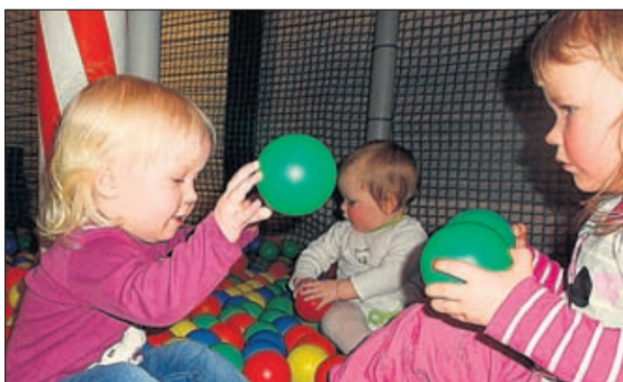
10 mammor och 15 barn har deltagit i familjecaféet under våren.

Det finns skötbord i anslutning till lekrummet och mikro finns i restaurangen som vi får använda när det behövs värmas barnmat. Kaffe och tilltugg kan köpas från restaurangen.