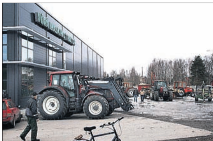
Vörå Maskin- och Traktors nya försäljningshall kommer att tas i bruk om några veckor.