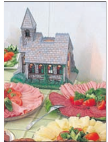
Värfrukosten i Bertby bönehus börjar bli tradition numera. I år är Kenya tema för diskussionen.