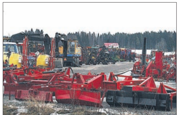
Redskapsplan längs Kaurajärvivägen fungerar som ett jättelikt skyltfönster.

maskiner från Sverige, Danmark och Tyskland. Sedan går våra egna montörer igenom dem grundligt innan de säljs, säger Heinull.