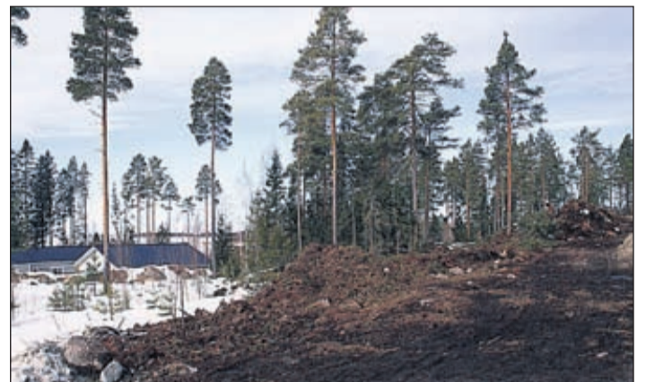
Oravaisten Tacksamlahden alueelta löytyy vapaita tontteja sekä kunnan alueella että yksityisomistuksessa.

– Mutta investoinnit tulevat olemaan noin 80 miljoonaa euroa jos kaikki toteutuu. Kiinteistövero kunnalle on noin 15 000 euroa vuodessa voimaa kohden, eli tuulivoima tarkoittaa tuloja maanomistajille ja kunnalle sekä uusia työpaikkoja, Rex toteaa.