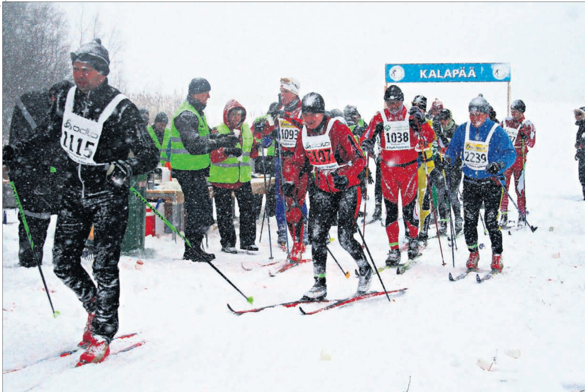
Viime vuonna satoi lunta Botnia Vasan aikana.