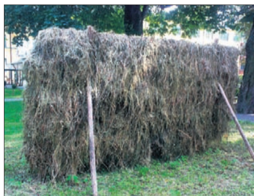
På hässjor kunde man torka höet också under regniga somrar.