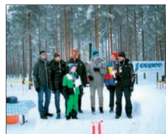
Vörålaget i landskapsstafetten.